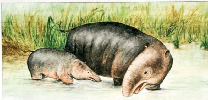
Dibujo de los moeritherios, una especie de proboscídeos extinguida que está emparentada con los elefantes.